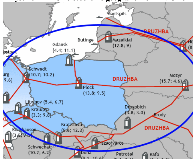
Rysunek 2 Bliskie otoczenie geograficzne PKN Orlen